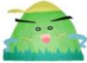
寺小マスコットキャラクター

寺岡小学校PTAは、一人ひとりがPTA活動に思いやりを持って取り組み、子供たちの成長と絆を感じて、「やって良かった、楽しかった、うれしかった」と笑顔で言えるPTA活動の実践を目指しています。