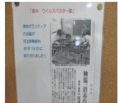
保護者ボランティアの活躍は6月19日の河北新報に掲載されました