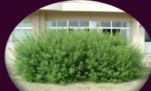
敷地内にある猫柳 校木にもなっています

柳生地区の名称より猫柳の花をデザイン化し、三本の線で名取川を表しながら、教育目標の「徳育」をオレンジ、「保育」を深紅、「知育」を濃紺で表現しています。また、右側の鋭い線は、蔵王の峰を表し、「柳」の字を豪書体でワンポイントとし、アクセントをつけています。 本校は仙台市の最南端に位置し、北は名取川、南は名取市、東は遠く太平洋、西は蔵王の高峰を望み、自然環境に恵まれた地域です。校歌にもそれが込められています。