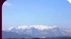
宮城県側から見た蔵王連峰