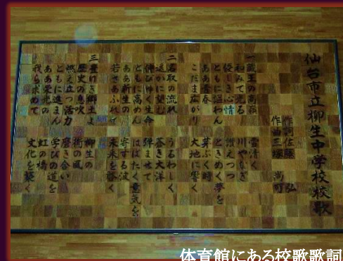
体育館にある校歌歌詞板

柳生地区の名称より猫柳の花をデザイン化し、三本の線で名取川を表しながら、教育目標の「徳育」をオレンジ、「保育」を深紅、「知育」を濃紺で表現しています。また、右側の鋭い線は、蔵王の峰を表し、「柳」の字を豪書体でワンポイントとし、アクセントをつけています。 本校は仙台市の最南端に位置し、北は名取川、南は名取市、東は遠く太平洋、西は蔵王の高峰を望み、自然環境に恵まれた地域です。校歌にもそれが込められています。