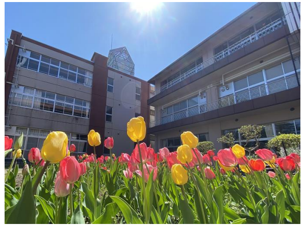
標高（海拔）211m の山の上にあります