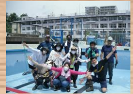
汗だくのプール掃除