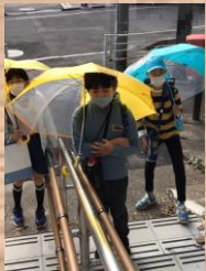
急な雨でも大丈夫！