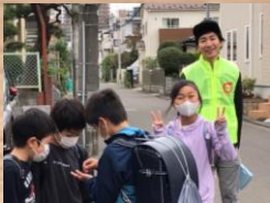
朝の防犯パトロール