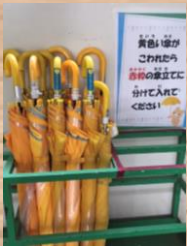
児童なら誰でも使える黄色い傘

土井晩翠資料室は平成15年（2003年）にオープン。PTAで定期的に清掃し、資料を大切に保管しています。