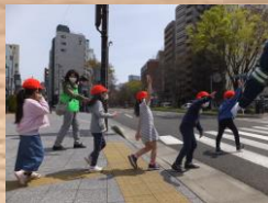
1年生交通安全教室