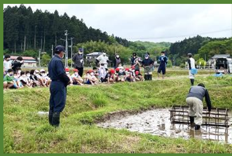
昔の道具も登場する田植え

また、約 370 年前から地域に伝わる「福岡鹿踊・剣舞」を昭和 50 年から福岡小学校の教育活動に取り入れ、保存会の方々に懇切丁寧に教えていただきながら伝承の心「あいさつする心」「楽しく踊る心」「道具を大切に作る心」を育み、ふるさとを愛する心を学んでいます。11 月後半からは、6 年生が師匠となり 3・4・5 年生の指導にあたるなど、心と体がよりたくましく育つ活動を行っています。