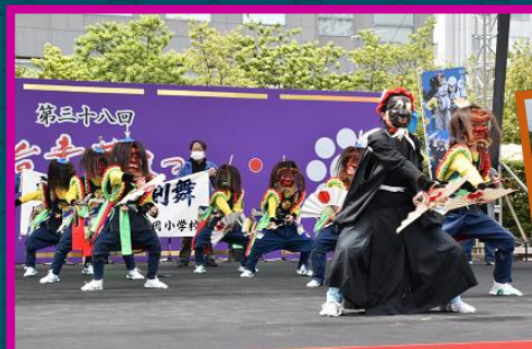
仙台青葉まつりで披露する迫力ある演舞