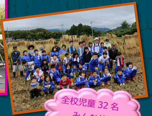
全校児童 32 名 みんな仲良し