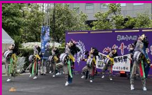
地域みんなで伝統を守る「福岡鹿踊・剣舞」