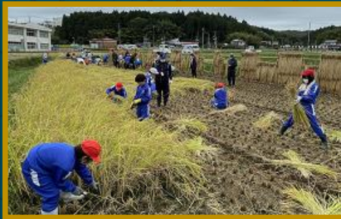
学年で役割を分担する稲刈り