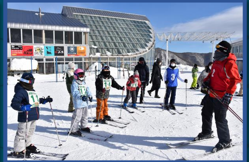
地域の方や保護者が講師に！ スキー教室