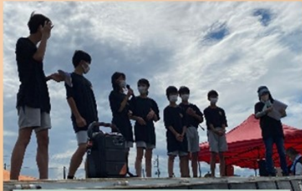
生徒スタッフの司会・進行

地域も! 先生も! 保護者も! そして生徒のみなさんと一緒に楽しい時間を過ごしました!