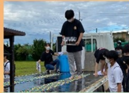
健康すぎて 誰も痛がらない足つぼw