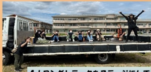
4+ロングトラックをステージにして