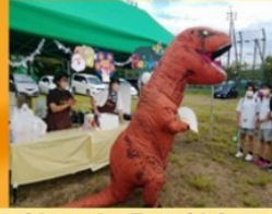
あまりに熱い会場の熱気に恐竜も登場!! 来年は全員で恐竜着て(笑)お祭り出来るといいね♪