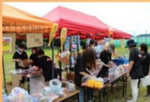
保護者もトスケと飲み物と!