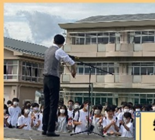
先生たちの意外な一面も見れました!