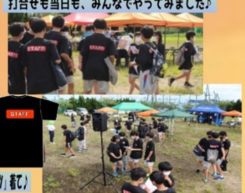
打合せも当日も、みんなでやってみました!