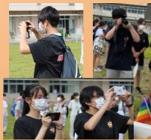
撮影も生徒と保護者! 地域フースヘもお手伝いしながら いろいろなお話出来ました!