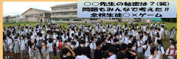
〇〇先生の秘密は? (笑) 問題もみんなで考えた!! 全校生徒〇×ゲーム