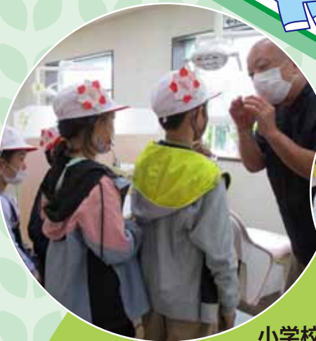
小学校周辺のお店を見学