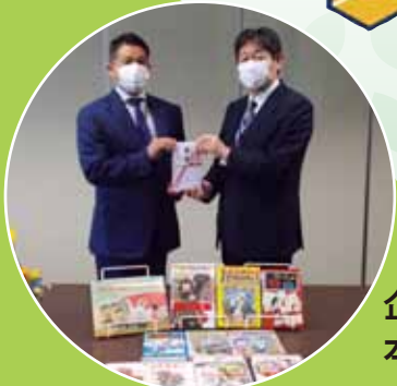
企業様から 本の寄贈