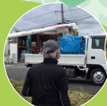
学童農園「かばっこ田んぼ」収穫体験