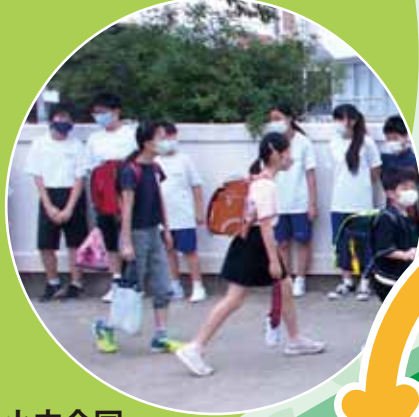
小中合同 挨拶運動