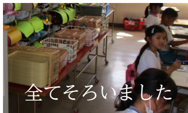
全てそろいました