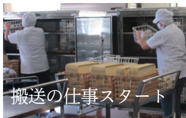
搬送の仕事スタート

朝のスタートは食器や飲み物をクラスごと分け、各クラスに運ぶことから始まります。その後トラックでおかずが届き、各クラスに運んでいきます。重い物を丁寧に扱いながら心を込めて搬送しています。