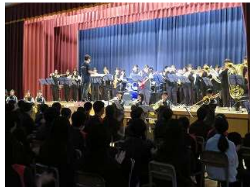
桜花祭(生徒会主催の文化祭)