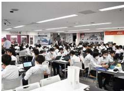
ファイナンスパーク学習

錦ヶ丘中PTAでは、下記の学校行事の運営のサポートを行うとともに、2022年度に発足した 錦ヶ丘小・中学校コミュニティ・スクール「トモスク」 (学校運営協議会)と連携した活動を行っています。