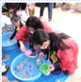
町内の夏祭りのお手伝い