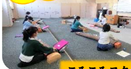
こみこみスクール「書道教室」