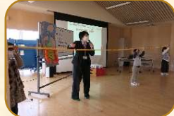
3年ヤクルトおなか元気教室