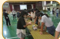
5年エネルギー講座