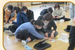
6年コミュニケーション作り

学年委員が協力し合い、児童も保護者も楽しめる様々な行事を企画・運営しています。※写真は昨年度の行事の様子です。