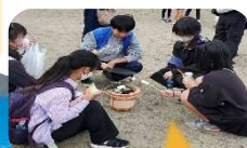
げんきっ子まつり「焼きマシュマロ」のようす

PTA主催「げんきっ子まつり」での焼きマシュマロや「学校へ泊まろう!」は大人気! 地域のお父さんを中心に活動中!