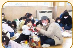
2年クリスマスリース作り