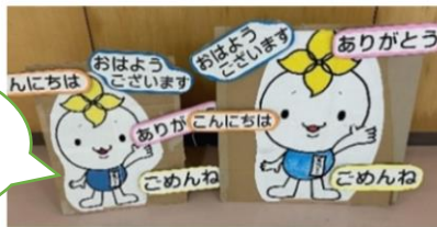
富沢小マスコット あねじろう